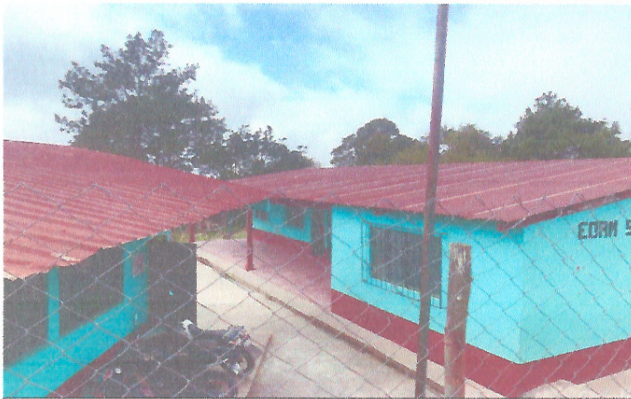
Foto 1: Mejoramiento cubierta de lámina ( cambio de lámina en toda la escuela).