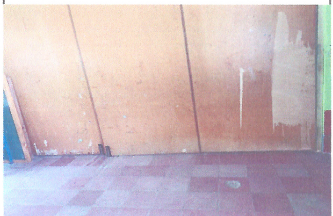
Foto 4: Mejoramiento de piso en todo el establecimiento (mejoramiento de piso cerámico)

Observación: Si es necesario se pueden agregar hojas adicionales y actualizar el número de hojas.