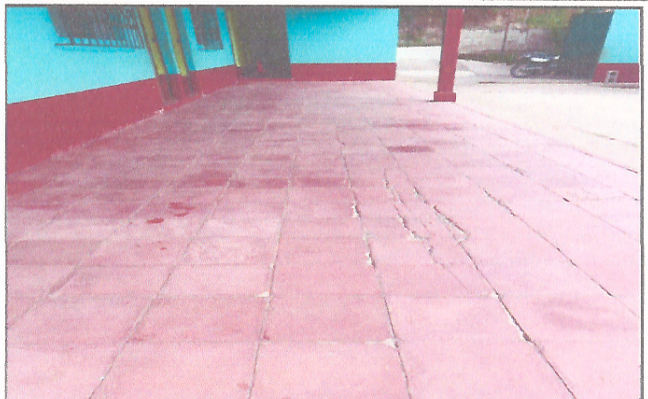
Foto 2: Mejoramiento de piso en todo el establecimiento (mejoramiento de piso cerámico)