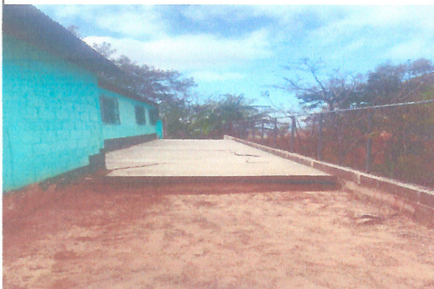
Foto 3: Mejoramiento en la estructura de techo (Techado de patio )